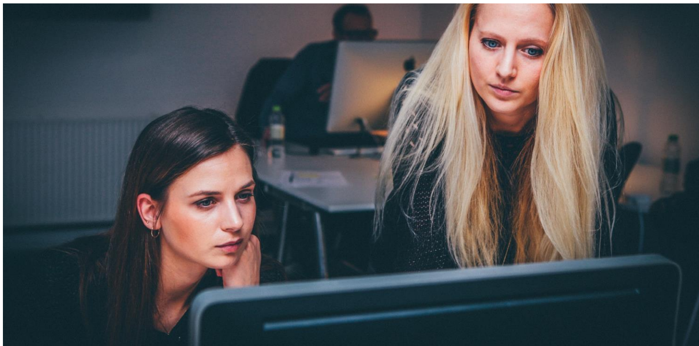
Andel av kommunala skatteintäkter per sektor, Smedjebackens kommun